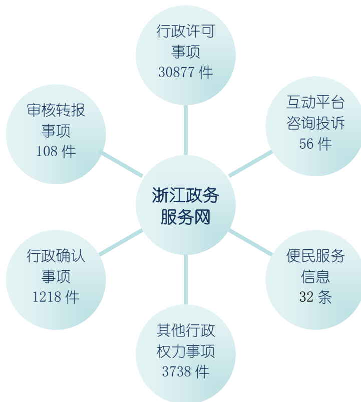
浙江政务服务网江北平台信息分布图

截至 12 月底，江北区行政权力运行系统行政审批事项类共收件 35941 件，办结数 35943 件，办结率 100%，对窗口工作人员的总体满意率达到 99.7%，全年没有发生企业和群众对窗口工作人员的有效投诉。另外，我办积极推行清单式审批代办工作机制的改革做法得到了省审改办的高度关注，省发改委为此专题形成《改革内参》。