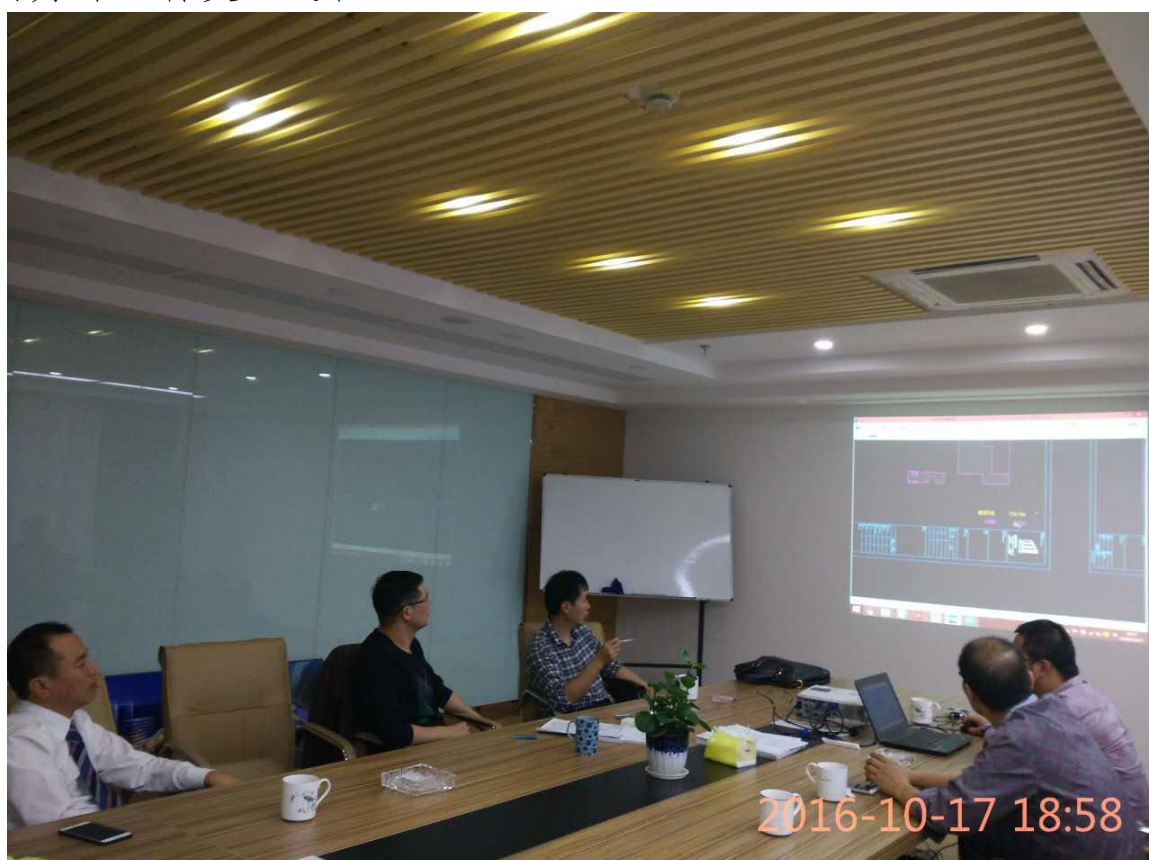
创新代办上门服务，传达相关审批信息，指导企业准备审批资料

目前，江北区行政服务中心网站已运行八年，网站上开设了政府信息公开专栏，并设立了公开意见箱和依申请公开的入口，同时在网站首页也设置了意见征集平台，增加了依申请公开信息的另外一种受理途径。